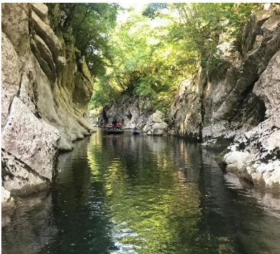
Gole del Calore- Felitto