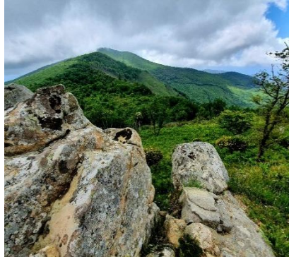
Monte della Stella-Cilento Antico