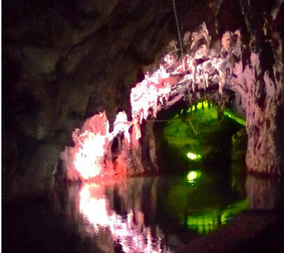
Grotte dell'Angelo Pertosa - Auletta