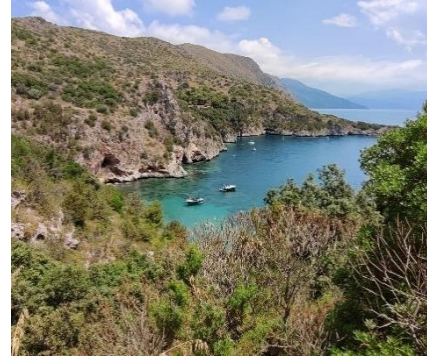
Sentiero Novi Velia al Santuario