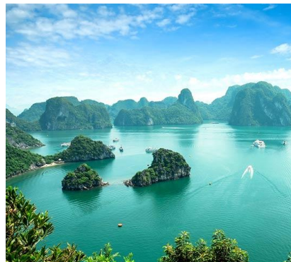
Isole di Nam Du