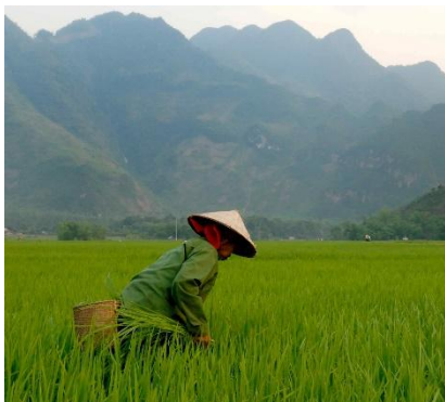
Le verdi colline del Vietnam