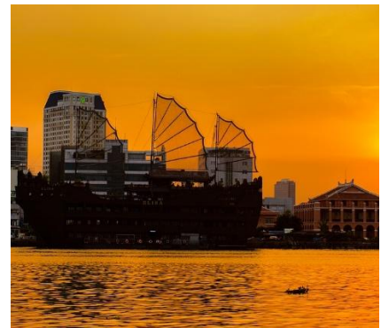
Veduta di Saigon

La baia di Halong è quasi sicuramente una delle prime destinazioni che vengono in mente quando si parla di Vietnam, grazie alla fama che essa ha ottenuto negli ultimi due decenni per i suoi paesaggi spettacolari.