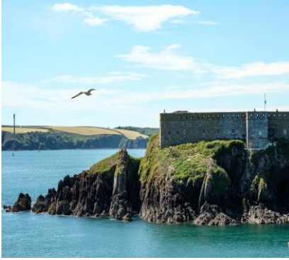
Pembrokeshire Coast National Park