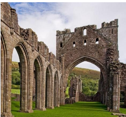
Abbazia di Llanthony