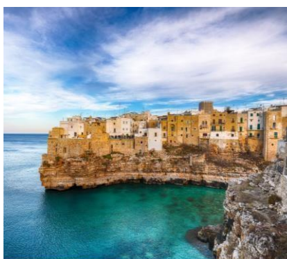
Polignano a Mare