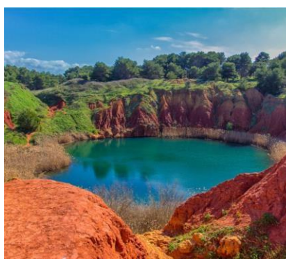
Laghetto di bauxite - Otranto