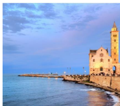
Cattedrale di Trani