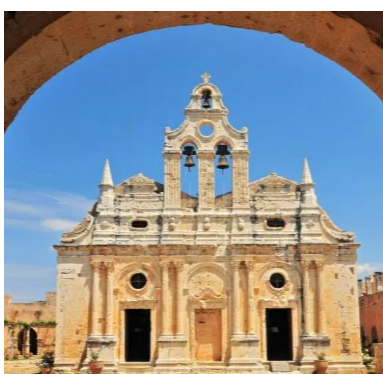
Monastero di Arkadi