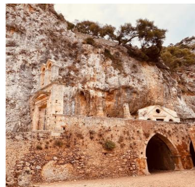
Monasteri di Katholikò