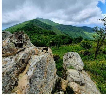
Monte della Stella-Cilento Antico