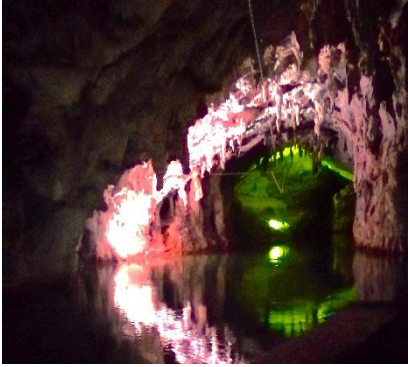
Grotte dell'Angelo Pertosa - Auletta