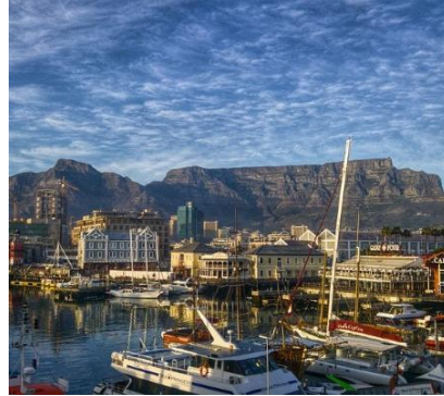
Città del Capo e Table Mountain