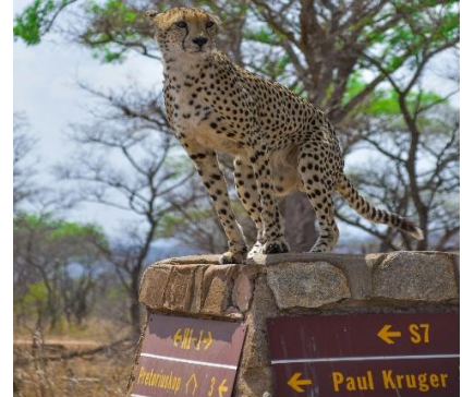
Kruger National Park