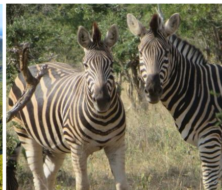
Giraffe durante il Safari