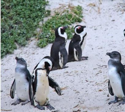
Pinguini a Boulders Beach