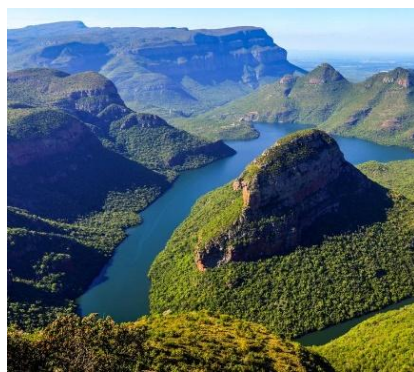
Blyde River Canyon Natural Reserve