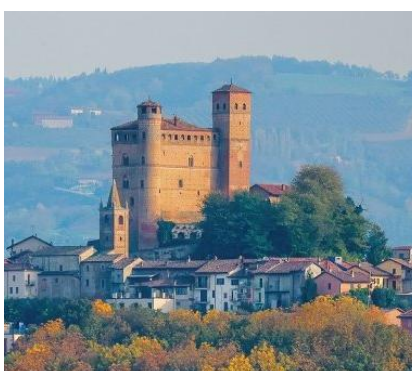
Castello di Serralunga