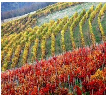
Il paesaggio delle Langhe