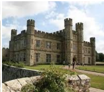
Castello di Leeds