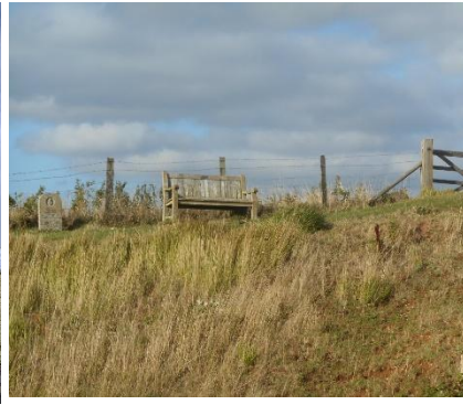
Lungo il North Downs Way