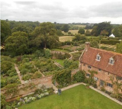
Giardini di Sissinghurst