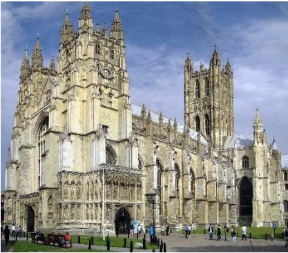
Cattedrale di Canterbury