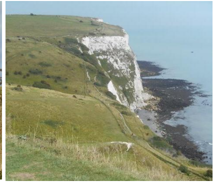
Le bianche scogliere di Dover