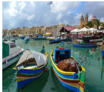
Il carattere affascinante di Gozo