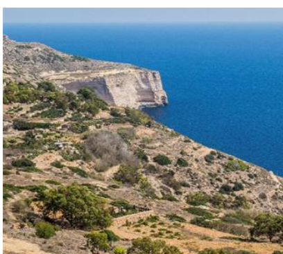
Scenari sconfinati a Dingli