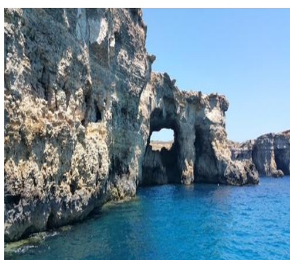
L'Isola simbolo dell'arcipelago: Comino