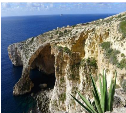
Dove si incontrano mito e realtà: Gozo