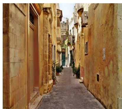
Perdersi nelle vie di La Valletta

Oltre che per la sua natura rigogliosa, l'arcipelago maltese affascina i visitatori con la sua storia antica, con i suoi resti preistorici e le sue città murate, crocevia di popoli, culture, lingue e tradizioni che in passato hanno lasciato il segno, plasmando il carattere forte e caparbio di quello che sarebbe poi diventato il popolo maltese.