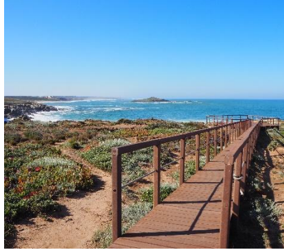
Parque Natural do Sudoeste Alentejano