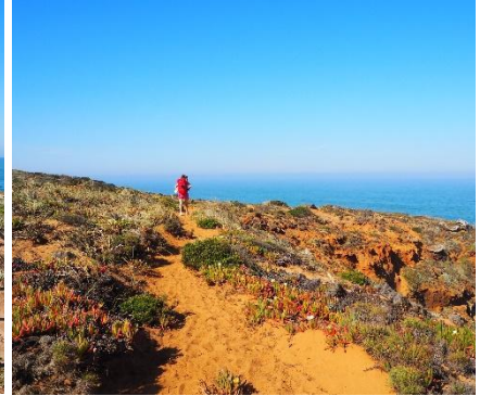
Cammino dei pescatori