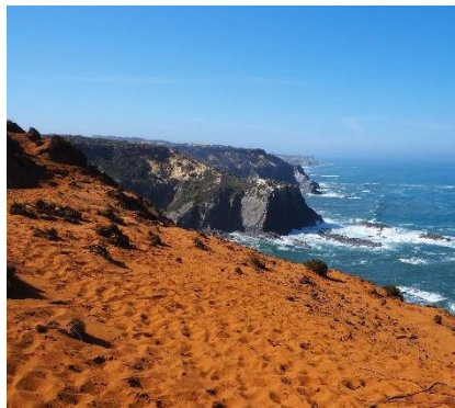
Dune di terra rossa