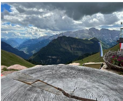
Vedute della Val di Fassa