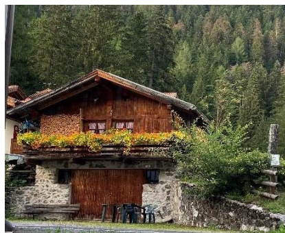
Baita in Val di Fassa