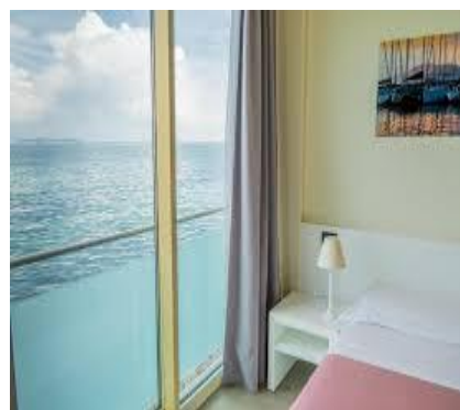
Camere vista lago