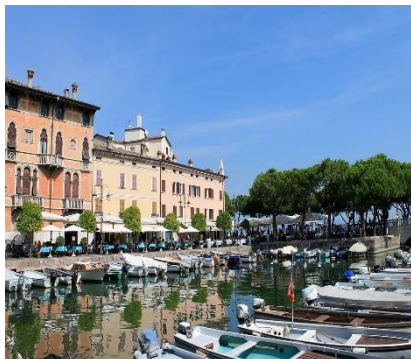
Desenzano del Garda