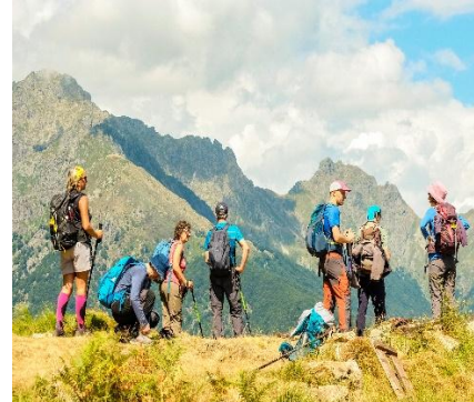
Vedute sulla Val Grande