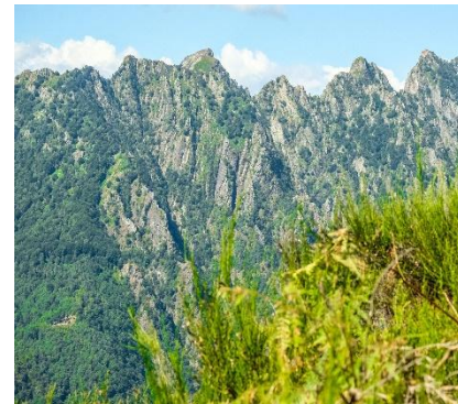
Margine occidentale della Val Grande