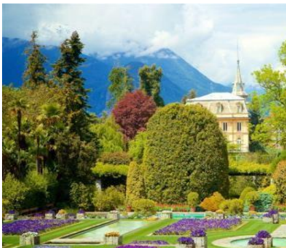
Giardino Botanico di Villa Taranto

La valle è infatti stata meta di pastori e boscaioli la cui vita faticosa e povera suscita interesse e ammirazione per la capacità di adattamento ad un territorio tanto impervio e inaccessibile. Una parte del Parco Nazionale è costituita dalla “Riserva Integrale del Pedum”, chiamata così dall’omonima montagna i cui versanti occidentali e settentrionali ne definiscono i confini; in questa parte del Parco la protezione è assoluta tanto che non è consentito alcun accesso umano. Camminare in Val Grande provoca forti emozioni, incorniciate dalla splendida area geografica del Lago Maggiore, con i suoi borghi pittoreschi, le rilassanti camminate lungo-lago, i ristoranti raffinati e accoglienti e le insuperabili Isole Borromeo, vanto internazionale di una regione soleggiata. In una settimana di viaggio alterneremo le esplorazioni nel Parco Nazionale con le visite ai maggiori centri di interessi culturali e naturalistici del lago, tra cui le predette isole e l’imperdibile giardino botanico di Villa Taranto. Vi aspettiamo!