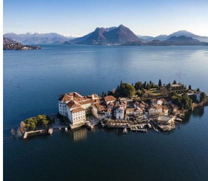
Le isole Borromeo