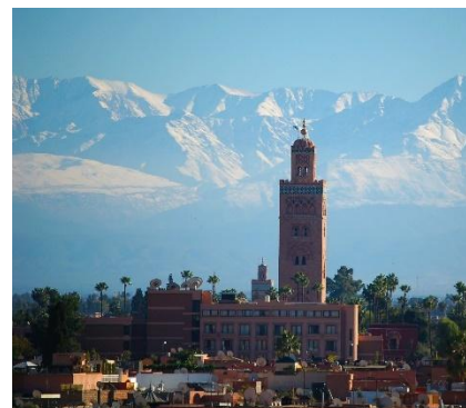
Città e montagne in Marocco