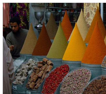
Mercato delle spezie