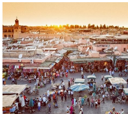
Piazza Djemaa El Fna - Marrakech