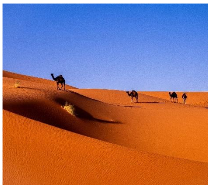
Deserto del Sahara