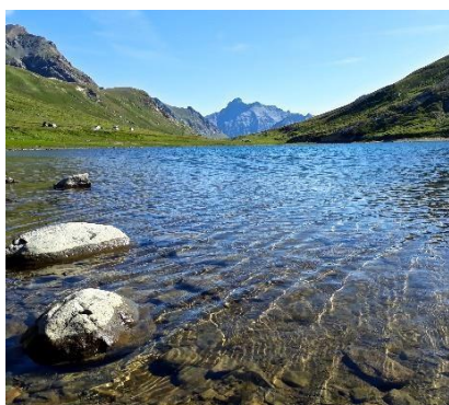
Pian del Nivolet