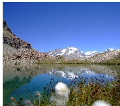
Pian del Nivolet