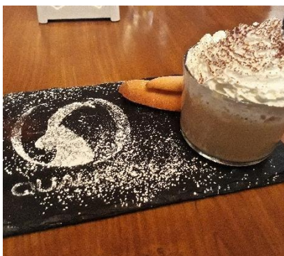
Tradizioni e Qualità