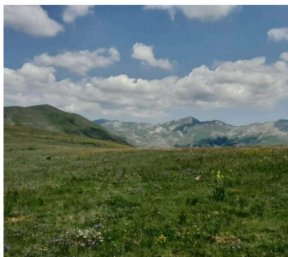
Piani di Ragnolo

intreccia con il mito della Sibilla Appenninica e con racconti sospesi tra magia e mistero. È una terra dove realtà e fantasia si sfiorano e le storie antiche riecheggiano tra vette e gole profonde. Visiteremo luoghi di grande fascino spirituale, come l'Eremo di San Leonardo e il Santuario della Madonna dell'Ambro, immersi in vallate selvagge. La nostra base sarà Sarnano, borgo medievale accogliente, punto di partenza ideale per esplorare queste montagne e gustarne i sapori autentici. Un viaggio che unisce cammino, natura e scoperta nel cuore di uno degli angoli più affascinanti dell'Appennino.