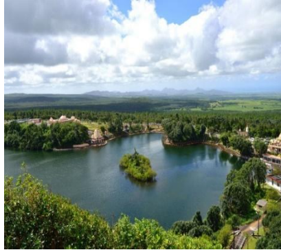
Lago Sacro Grand Bassin