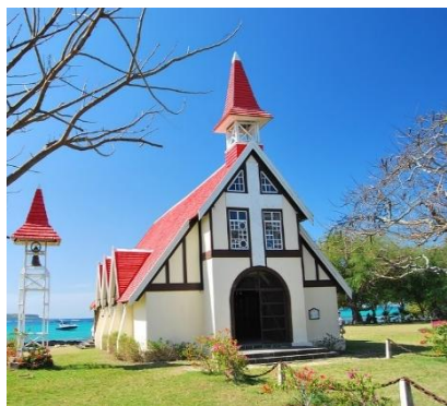
Chiesa a Cap Malheureux