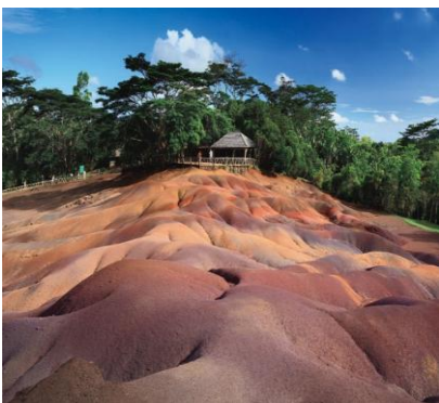
Terra dei Sette Colori