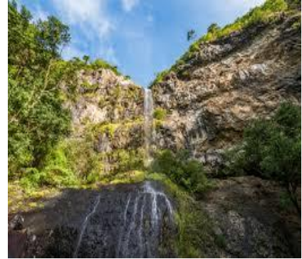
Black River Gorge National Park