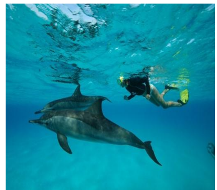
Ricerca dei delfini