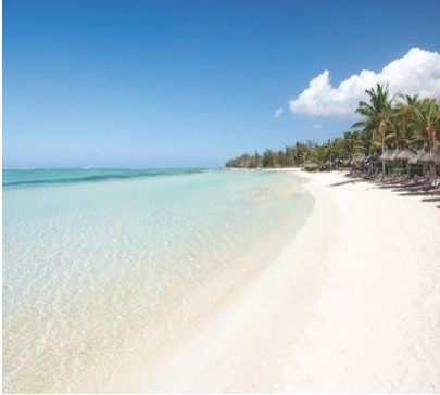
La sabbia e il mare a Mauritius