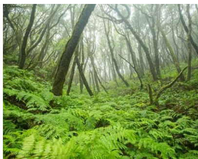
Il Garajonay National Park