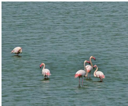
Valli di Comacchio