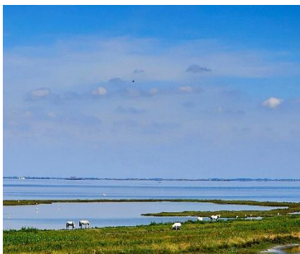
Oasi di Boscoforte