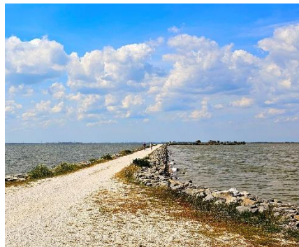
Argine degli Angeli