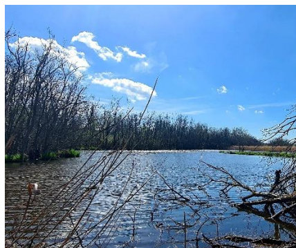
Oasi di Punta Alberete