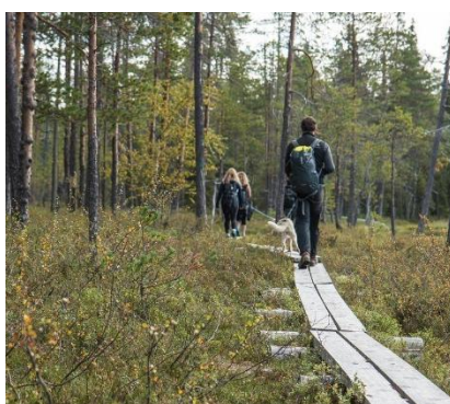
Parco Nazionale Oulanka