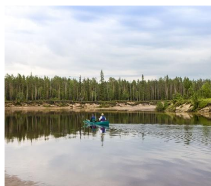
Canoa nel Parco Nazionale Oulanka