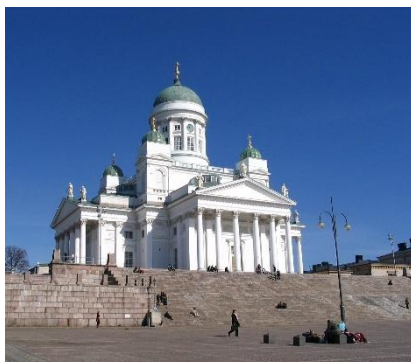
Cattedrale di Helsinki