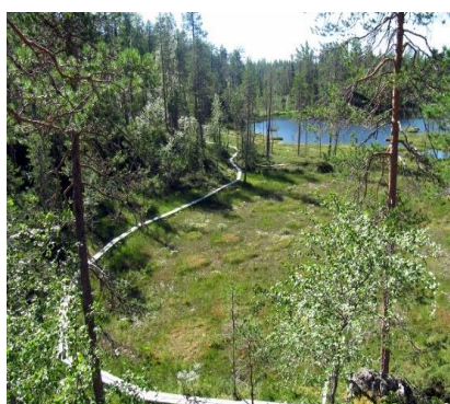
Small Bear Trail