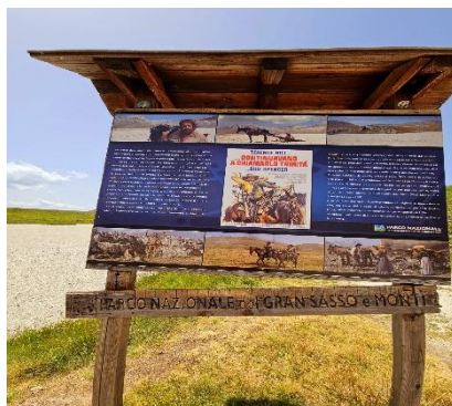
Canyon dello Scoppaturo