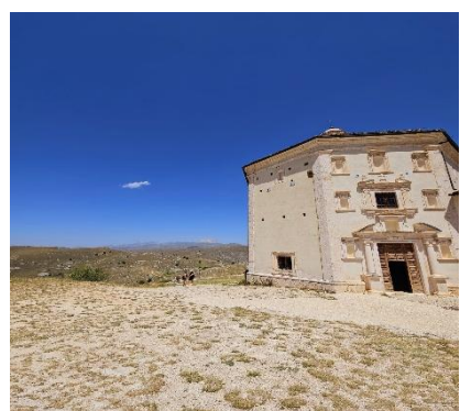
Chiesa Santa Maria della Pietà