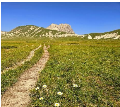
Vista sul Gran Sasso