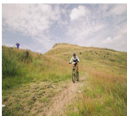
Pedalando nel cuore dell’Abruzzo