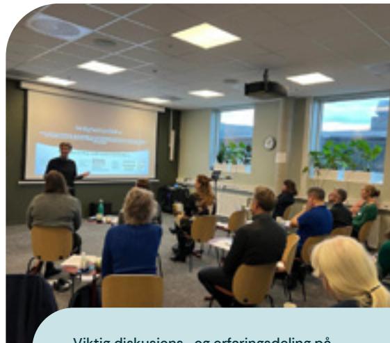
Viktig diskusjons- og erfaringsdeling på høstens fagseminar om frivillighet i palliasjon.