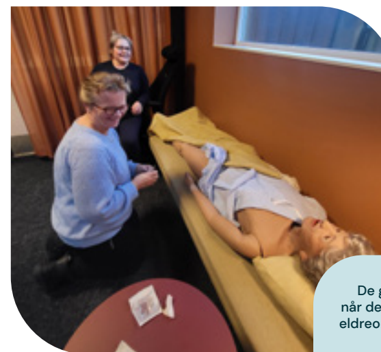
De geriatrike simuleringsdukkene er i bruk når deltakerne ved etterutdanningen Palliativ eldreomsorg øver på praktiske prosedyrer.

Siden oppstart i januar 2017 har 863 deltagere fra alle landets fylker og 147 kommuner gjennomført utdanningen, av disse 151 deltakere i 2022.