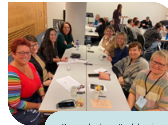
Gruppearbeid og nettverksbygging under nasjonal koordinatorsamling.

Blant aktuelle emner kan nevnes juridiske perspektiver, maler og eksempler på retningslinjer, taushetsplikt og avtale med frivillige. Innholdet er blitt til i møtet med praksisfeltet og med flere hundre koordinatorer som har gjennomført Verdighets-senterets utdanning Frivillighetskoordinering – eldreomsorg . En slik erfaringsbasert innfallsvinkel vil kunne supplere fagutvikling og forskning på feltet. Målgruppen er primært ansatte med ansvar for aktivitetstilbud og samarbeid med frivillige på sykehjem. Men håndboken vil også være relevant ved andre samspillsarenaer, som for eksempel seniorsentre. Boken er et samarbeid mellom Verdighets-senteret og Utviklings-senter for sykehjem og hjemmetjenester – Trøndelag sør, og det er planlagt ytterligere én håndbok, rettet mot hjemmetjenesten.