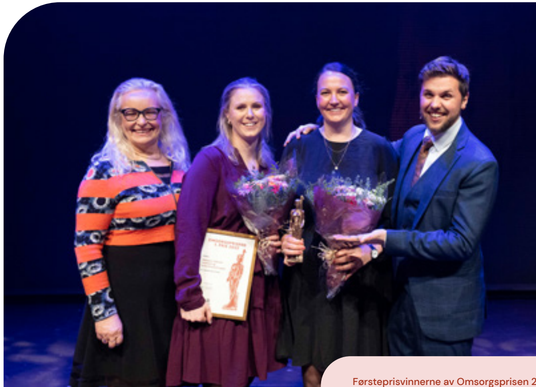
Førsteprisvinnerne av Omsorgsprisen 2022 flankert av prisutdeler og konferansier