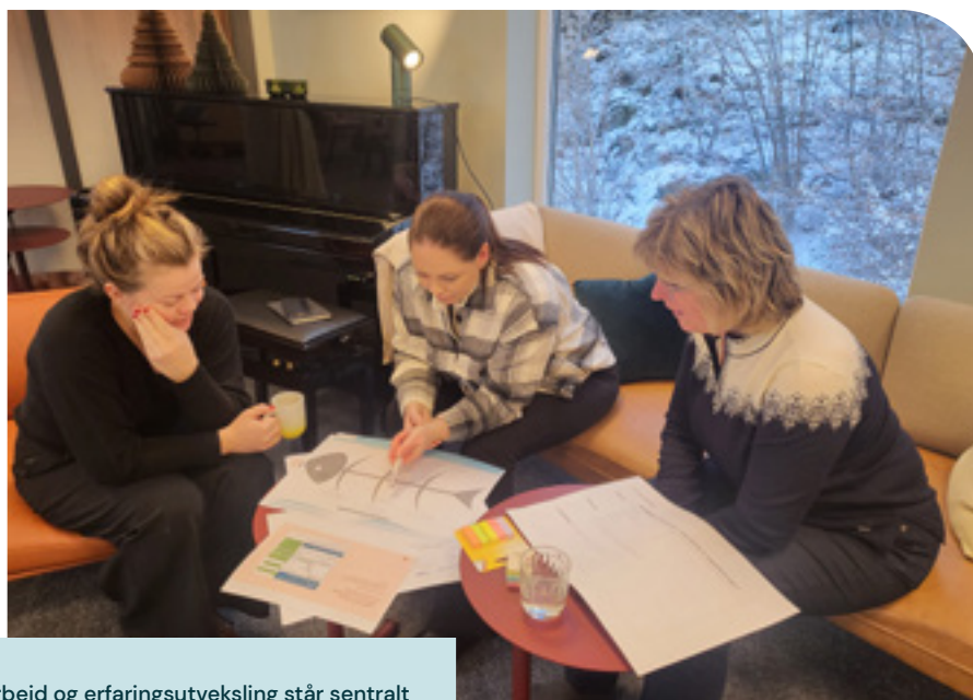
Gruppearbeid og erfaringsutveksling står sentralt i etterutdanningen Praktisk implementering (EPI).

En egen pilot ble startet opp i september 2022, med ti deltakere, hvorav to interne fra Verdighetsenteret. Deltakerne vil ha fullført etterutdanningen våren 2023. Kommunene Sandnes, Namsos, Øygarden og Bergen er representert i dette kullet.