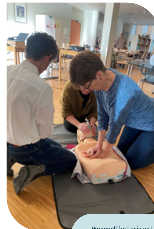
Personell fra Lesja og Dovre kommune fikk praktisk trening i basal hjerte og lungeredning (HLR) m.m.

Etter hvert som pandemiens restriksjoner ble opphevet våren 2022, økte også forespørslene om fysisk fagformidling med praktisk trening i bruk av verktøy og prosedyrer under veiledning. Det å gjennomføre fysiske fagdager eksternt er krevende, da mye utstyr må transporteres og ansatte fra Verdighetsenteret må reise. Men på denne måten kan mange fra samme arbeidsplass få lik kompetanse og faglig påfyll. Det blir på slike fagdager også lagt opp til faglige diskusjoner og refleksjoner. Dette er noe som ofte er vanskelig å få til i en travel arbeidshverdag.