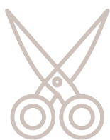
СХЕМА СБОРКИ РАСПЕЧАТАННОЙ ВЫКРОЙКИ

При работе с трикотажем рекомендуется пользоваться специальными иглами для шитья трикотажа. У них шаровидное острое иглы, которое при шитье раздвигает петли трикотажа и не пробивает их.