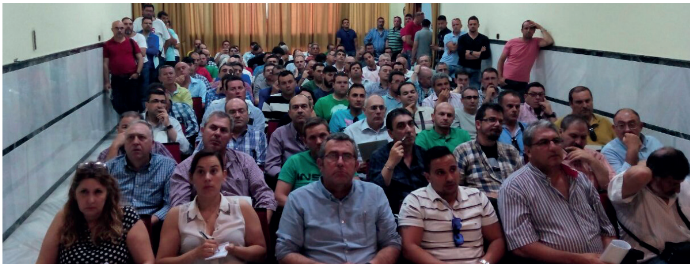
En Sevilla, el salón de actos se quedó pequeño para tantos asistentes. Debajo, La Rioja (izq) y Cáceres.