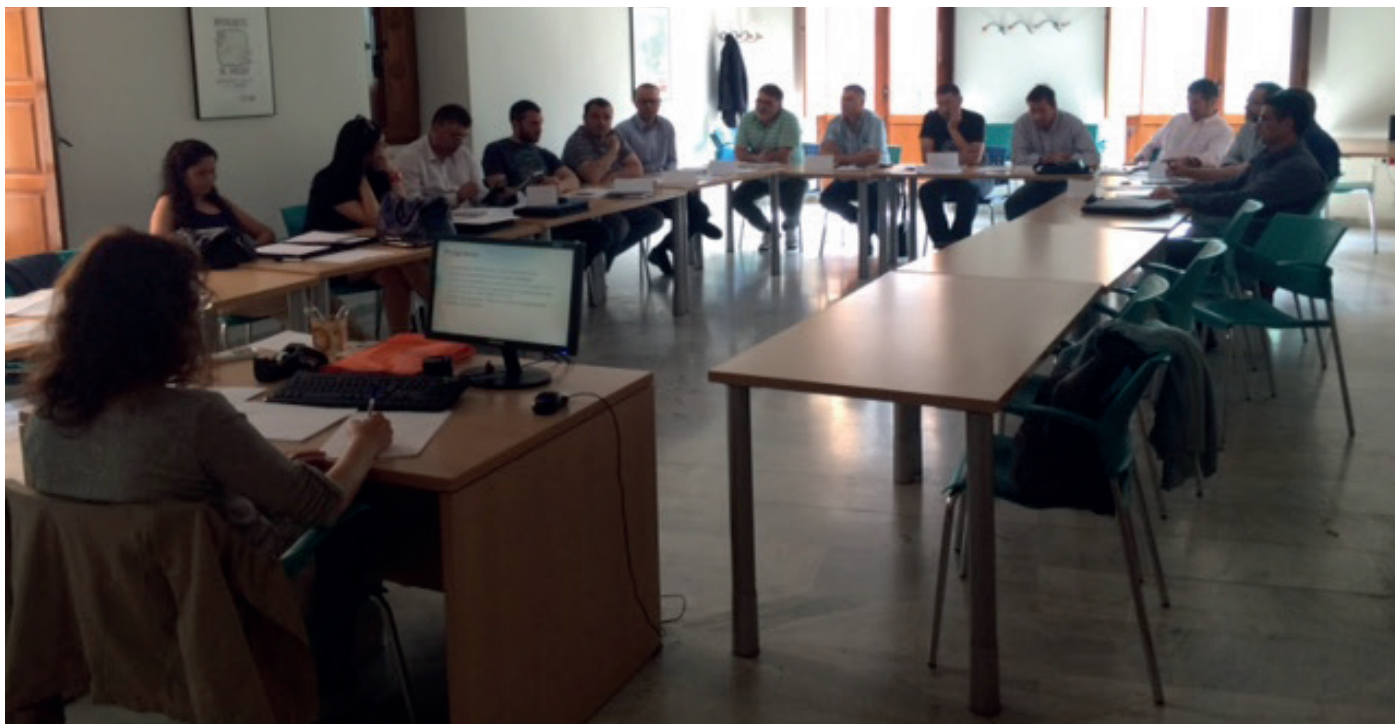
Imagen de la reunión celebrada en Valencia el día 5 de mayo.

El objetivo de este ciclo es formar en conceptos básicos de igualdad de oportunidades