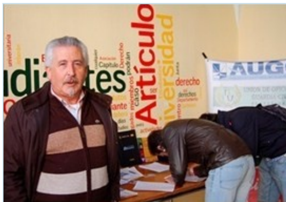
Recogida de firmas en la Facultad de Derecho

Además de recoger firmas los estudiantes de derecho pudieron conocer de primera mano la verdadera situación en la que se encuentra la guardia civil, para ello se les entregaron varias sentencias favorables relativas a retiradas de complementos o los expedientes abiertos a los representantes de los guardias por hacer ejercicio de la libertad de expresión. También se le entregó en mano al