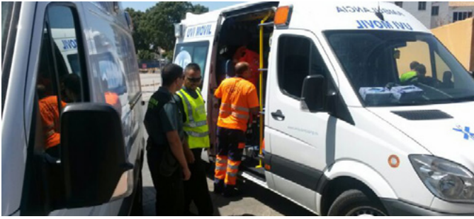
Guardias civiles junto a sanitarios de Melilla

Guardias civiles de la sección de fiscal socorrieron el 8 de julio a una mujer que se puso de parto en el puesto fronterizo de Beni Enzar Farhana de Melilla, mostrando así el lado más humano de quienes forman este Cuerpo, cuya labor, en numerosas ocasiones, trasciende las funciones que le son encomendadas.