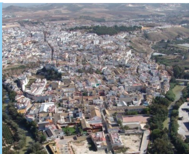
Imagen panorámica de la localidad de Puente Genil, en Córdoba, donde ocurrieron los hechos.

Los servicios jurídicos de AUGC han asesorado y representado a un guardia civil que fue agredido por un vecino de Puente Genil, al cual el Juzgado de lo Penal de Córdoba ha condenado como autor de un delito de atentado a agente de la autoridad y dos delitos leves de lesiones, a la pena de tres años y tres meses de prisión, así como a indemnizar al agente agredido por las lesiones sufridas con más de 2.100 euros. Los hechos tuvieron lugar el 20 de julio de 2016, cuando el agresor circulaba en bicicleta y dos guardias civiles procedieron a darle el alto al reconocerlo y constarle varias requisitorias pendientes.