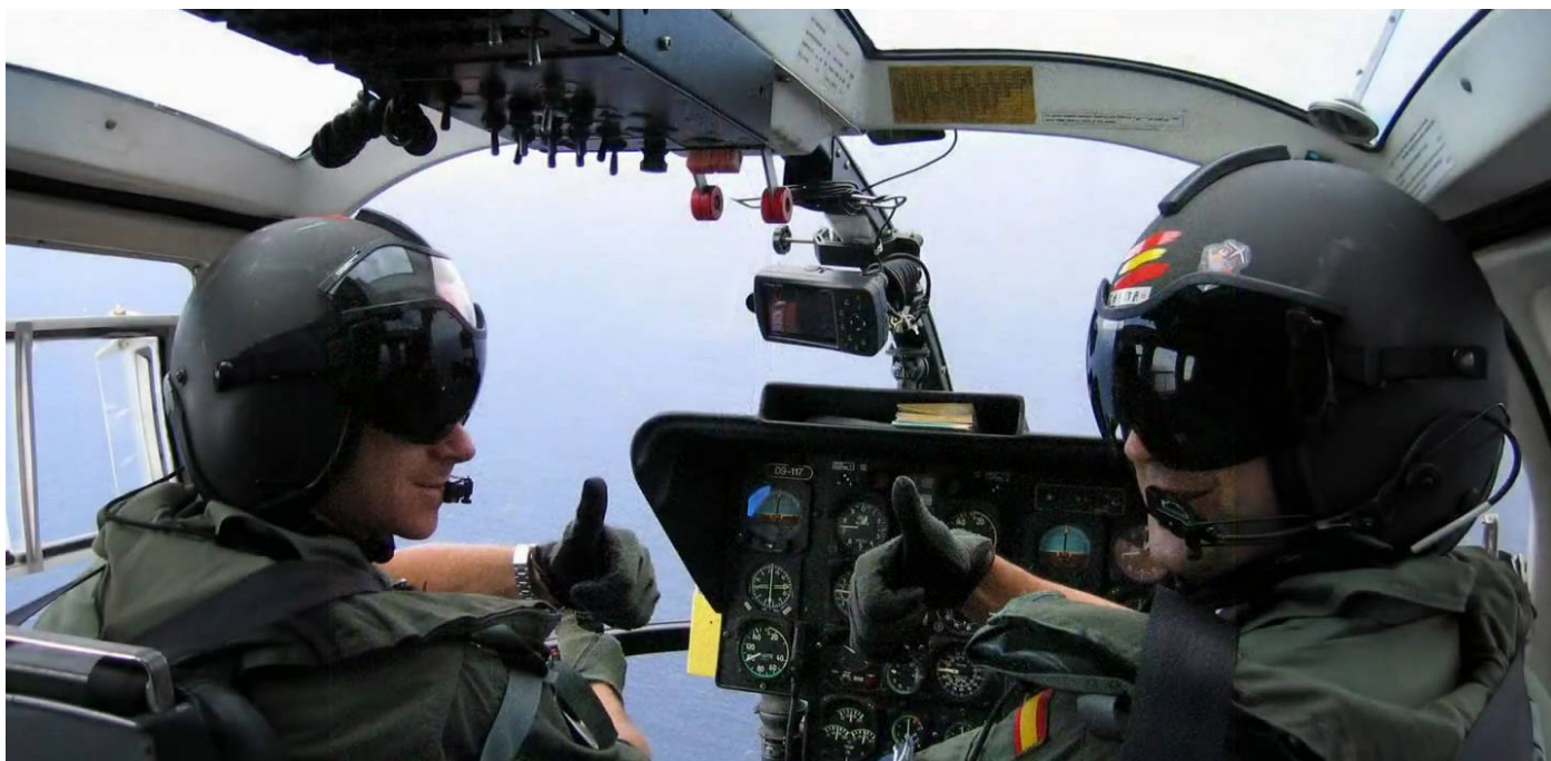
Dos pilotos de la Guardia Civil en el transcurso de un vuelo.

El pasado día 16 de marzo AUGC Madrid mantuvo una reunión con el Coronel Jefe del Servicio Aéreo de la Guardia Civil, con el objetivo de seguir avanzando en los derechos de nuestros afiliados y establecer puentes de comunicación directa entre la Jefatura y la asociación, con la presentación de nuestra Secretaría General. El encuentro se realizó en un ambiente cordial y esperamos que dé frutos para que se solucionen lo antes posible los problemas que las unidades nos han trasladado y que nosotros mismos observamos en cumplimiento de nuestra labor asociativa.