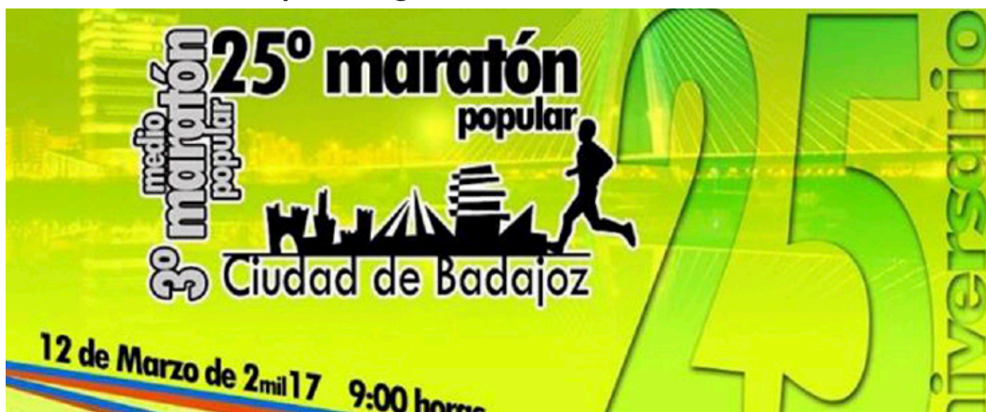
Cartel de la XXV Maratón de Badajoz.

La Delegación en Badajoz de la Asociación Unificada de Guardias Civiles, ha emitido sendos informes a la Dirección General de Tráfico y a la Secretaría de Estado de Seguridad donde se hace constar el incumplimiento de la normativa interna de la Guardia Civil en el nombramiento de servicios extraordinarios en la celebración de la 25ª Maratón Popular de Badajoz, la cual tuvo lugar en la capital pacense en pasado domingo 12 de marzo.