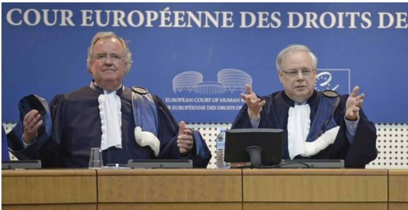
Miembros del Tribunal Europeo de Derechos Humanos, en Estrasburgo.

AUGC ha solicitado la inscripción del SUGC acogiéndose a las sentencias dictadas recientemente contra Francia por parte del Tribunal Europeo de Derechos Humanos