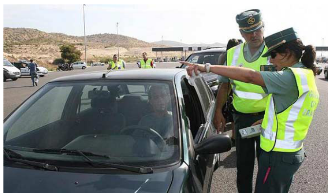
Una pareja de la Guardia Civil realiza un control de tráfico

El afectado, representado por AUGC Córdoba, reclamó lo detraído pero el Director General de la Guardia Civil lo desestimó, por lo que tuvo que recurrir a la justicia a través de la interposición de recurso contencioso administrativo ante el TSJA. Este Tribunal ahora ha dictado una sentencia en la que obliga a la Dirección General a indemnizar al agente con más de 7.000 euros.