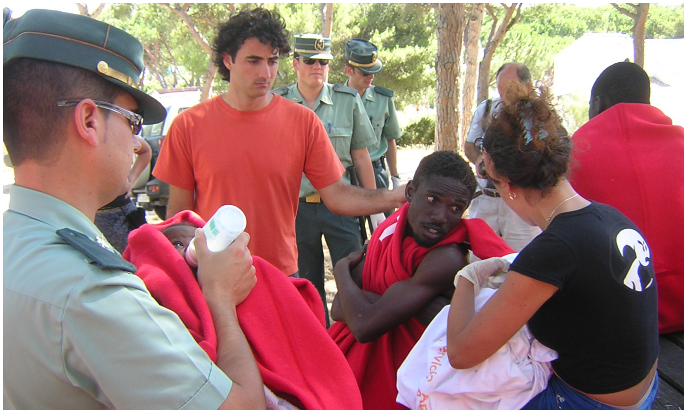
Varios guardias civiles atienden a inmigrantes que llegan a las costas españolas

La organización realiza un amplio despliegue en la prensa para denunciar la desprotección jurídica en la que se encuentran los agentes