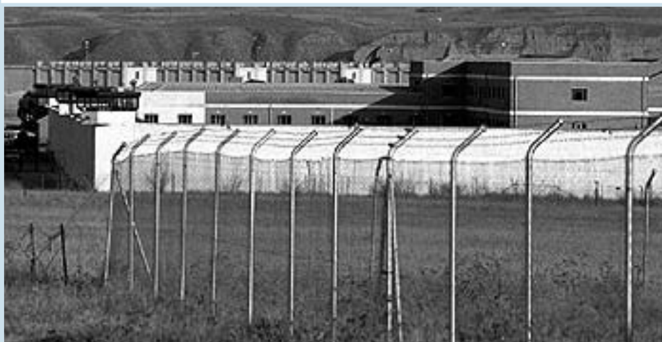
Prisión militar de Alcalá de Henares