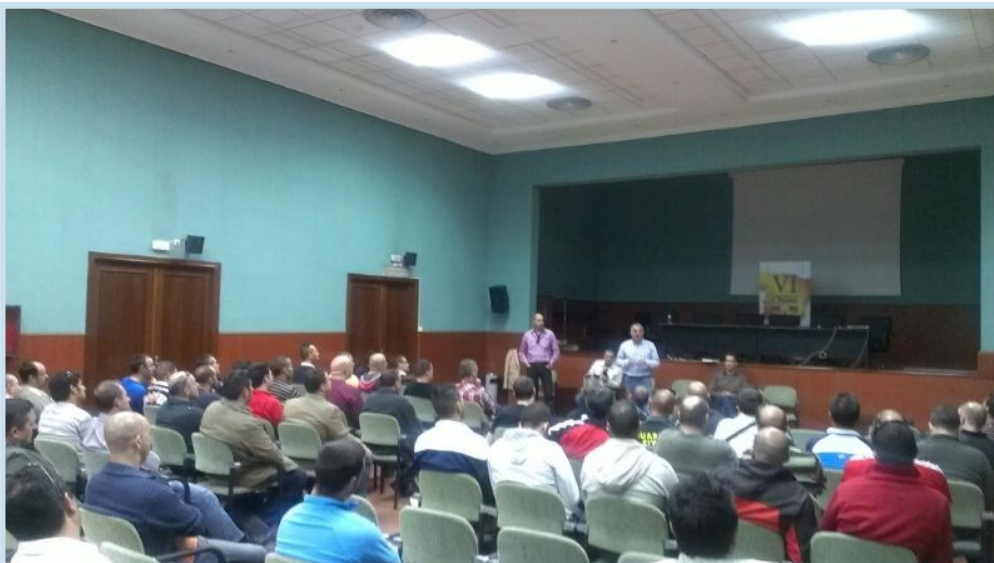
Aspecto del Salón de Actos de la Comandancia de Melilla, donde se celebró la multitudinaria Asamblea de AUGC.

La reunión se ha producido en un momento de gran tensión para los agentes por el problema de la inmigración. Registrándose incidentes por este motivo cada vez más graves, el último de ellos la agresión sufrida por seis agentes de la Guardia Civil con los integrantes de una patera que intentaba llegar a la ciudad autónoma. Por este motivo se ha informado a los asistentes del protocolo que deben seguir en relación a la inmigración ilegal, protocolo que viene marcado por la normativa vigente y que en el caso concreto de las pateras marca que deben ser entrega-