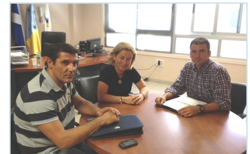
Reunión de los representantes de AUGC Canarias con la diputada Ana Oramas.

La supresión del “pasaporte vacacional” a los guardias civiles que prestan servicio en los dos archipiélagos españoles ha llegado a la Cámara Baja de manos de Ana Oramas, diputada de Coalición Canaria, quién no sólo cuestiona al gobierno por haberlo retirado cuando parte de la plantilla ya lo había utilizado ya que se aprobó el 1 de agosto, cuando parte de los agentes ya habían estado de vacaciones en la península, por lo que, como dice Ana Oramas en su pregunta no se ha respetado el derecho de igualdad.