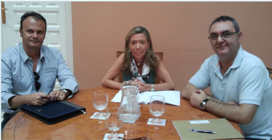
La subdelegada del gobierno en Sevilla junto a los representantes de AUGC

RAI y RAU para las unidades de tráfico, hecho que desconocía así como el estado de algunas instalaciones de la Guardia Civil en la provincia. Se le ha entregado también un informe elaborado por el Secretario de Comunicación y relaciones institucionales sobre el desfase que existe en la delimitación de competencias en materia de tráfico entre Guardia Civil y Policía Local en Sevilla capital y en otras localidades de la