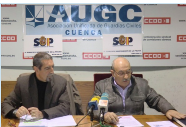
Presentación del Modelo Policial

Desde AUGC se ha pedido al Gobierno que escuche a los profesionales de la seguridad pública y sobre todo que revise las propuestas presentadas en su Modelo Policial y claves para poner fin a episodios como el del Consulado francés, que se repiten más a menudo de lo que trasciende a la sociedad.