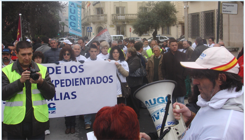
Los manifestantes escuchan el manifiesto al final de la manifestación

A la manifestación se han sumado representantes de AUGC de Cantabria, Las Palmas, Cáceres, Ciudad Real, Madrid, Toledo, Córdoba, Cádiz, Sevilla y Granada, pero también estuvieron apoyando a los expedientados representantes del Sindicato Unificado de Policía (SUP), la Asociación de Policías Locales de Badajoz (Aspolobba) y Comisiones Obreras. También fue muy significativa la presencia de representantes de Izquierda Unida por medio de los dos concejales de IU