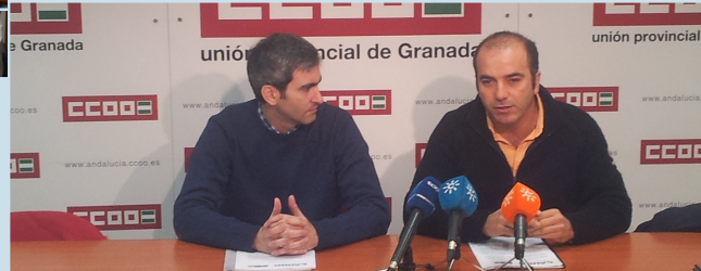
De izda a dcha representantes de AUGC Cuenca, Cantabria, Burgos, Cádiz, Granada y Tenerife .

Cuenca, Cantabria, Cádiz, Tenerife, son algunas de las Delegaciones de AUGC que, junto al SUP han hecho llegar su propuesta de reestructuración del sistema policial español. Una idea cuyo eje gira en torno a la unificación de los dos cuerpos policiales nacionales, tanto a nivel de infraestructuras como de mandos. Con ello, se conseguiría, en estos tiempos que corren, de duro retroceso económico, un ahorro económico superior al 50%. Una medida que también contribuiría a evitar incidentes relacionados con los problemas de organización y competencias. Y se traduciría en ventajas para la sociedad que vería