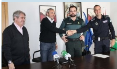
Los promotores del curso.

Tesis, las del juez, que AUGC comparte plenamente y que desde la Guardia Civil deberán aclarar si comparten o no, pues lo que hasta ahora vienen demostrando es que quieren convertir a los guardias civiles, no en garantes de la seguridad ciudadana y vial, sino en máquinas registradoras.