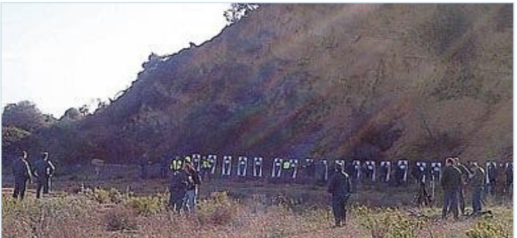
Guardias civiles realizando prácticas de tiro al aire libre

4. Horarios de servicio en la Comandancia de Ávila, donde el inicio va de