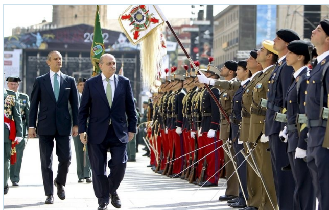
El Mº del Interior pasa revista en Zaragoza a la formación durante los actos programados por el día de la Patrona.

Los actos programados a lo largo de toda España para festejar la patrona de la Guardia Civil son, a juicio de AUGC, en derroche que no se puede permitir el país. Los trabajadores de la Guardia Civil no pueden entender que el Gobierno les recorte, una vez más, su ya menguado salario con la excusa de la crisis económica, pero en cambio permita que se dilapide dinero público en unos fastos que sólo son actos de ostentación para uso y disfrute de los mismos de siempre.