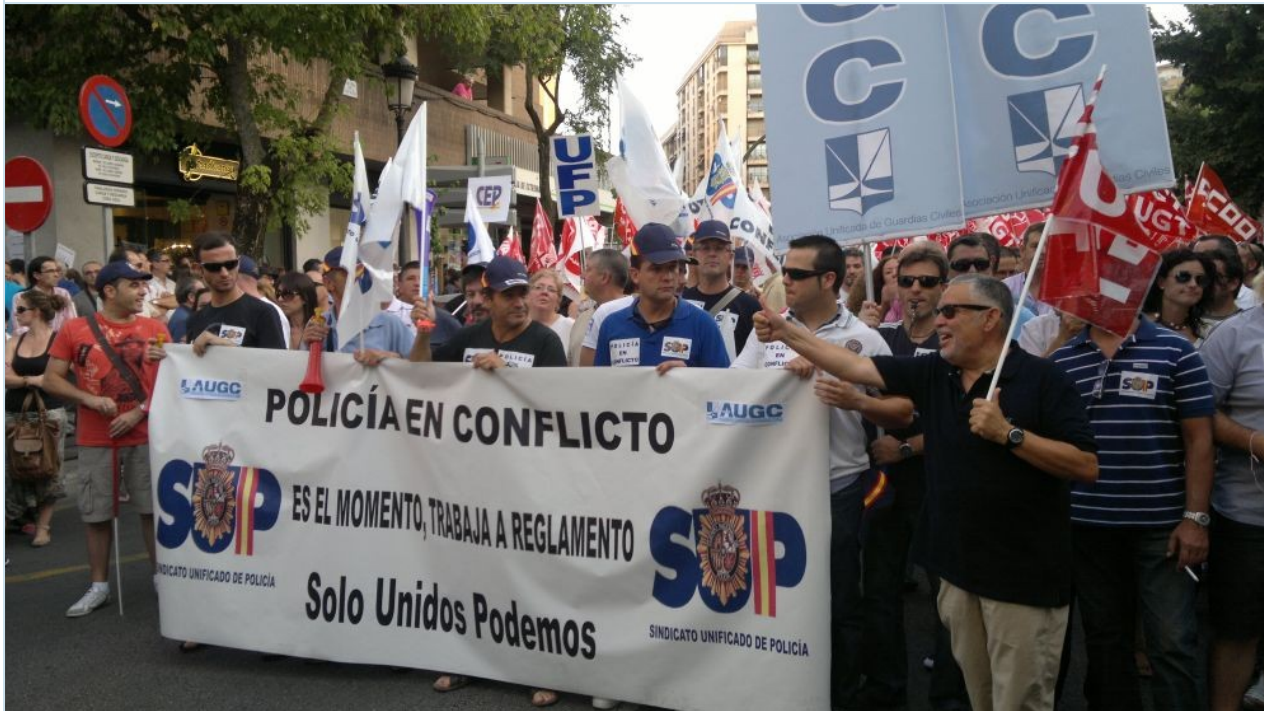
Policías y guardias civiles juntos en contra de los recortes aprobados por el Gobierno.

Por todo ello AUGC y SUP rechazan las acusaciones que esta organización arcaica y retrograda realiza a nuestras organizaciones, y las condenamos por miserables, mezquinas y despreciables, que solo califican a sus autores. Además anunciamos que los equipos jurídicos de AUGC y SUP ya están estudiando las