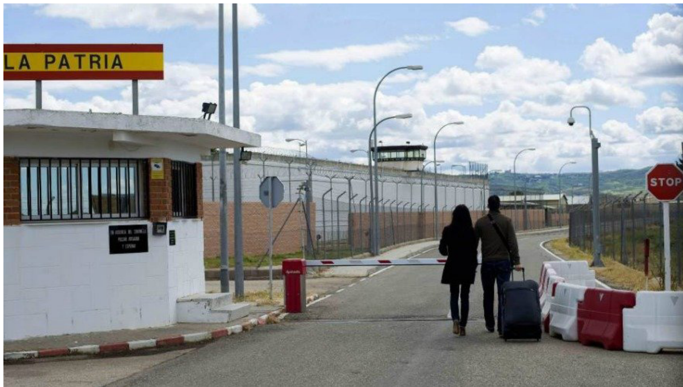
Imagen de archivo de un guardia civil ingresando en el penal militar de Alcalá Meco.

Una vez más, la desproporcionada e injustificada aplicación del Código Penal Militar a los guardias civiles ha supuesto el calvario de una prolongada condena en un penal militar a un trabajador del Cuerpo.