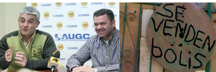
Miembros de la Junta Nacional de AUGC. Esta imagen habla por sí misma.

No sólo la prensa escrita ha suscitado el interés por la campaña. Estos días atrás, hemos podido ver y oír a través de las distintas televisiones y radios nacionales y autonómicas, varios reportajes sobre el asunto donde nuevamente, dirigentes de AUGC han dado la cara públicamente para explicar la situación al resto de ciudadanos. En nuestra web, puedes obtener enlaces a algunos videos y audios extraídos de las cadenas radiofónicas: http://www.augc.org