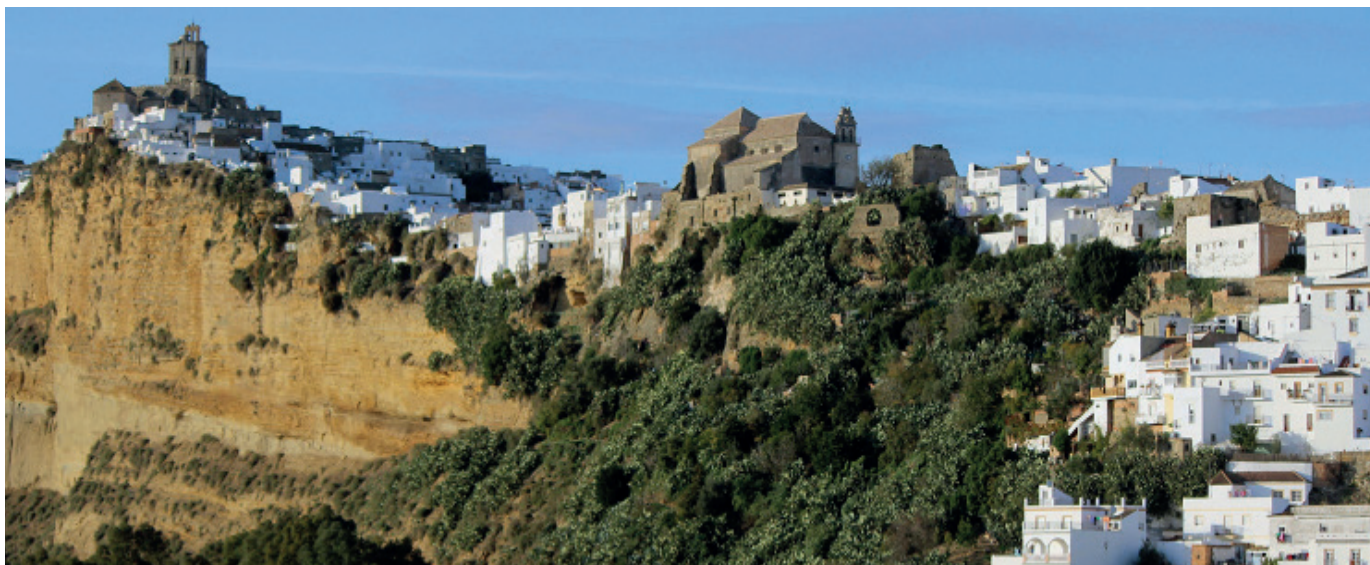
Panorámica de la localidad gaditana de Arcos de la Frontera, donde ejerce su influencia el brigada denunciado.