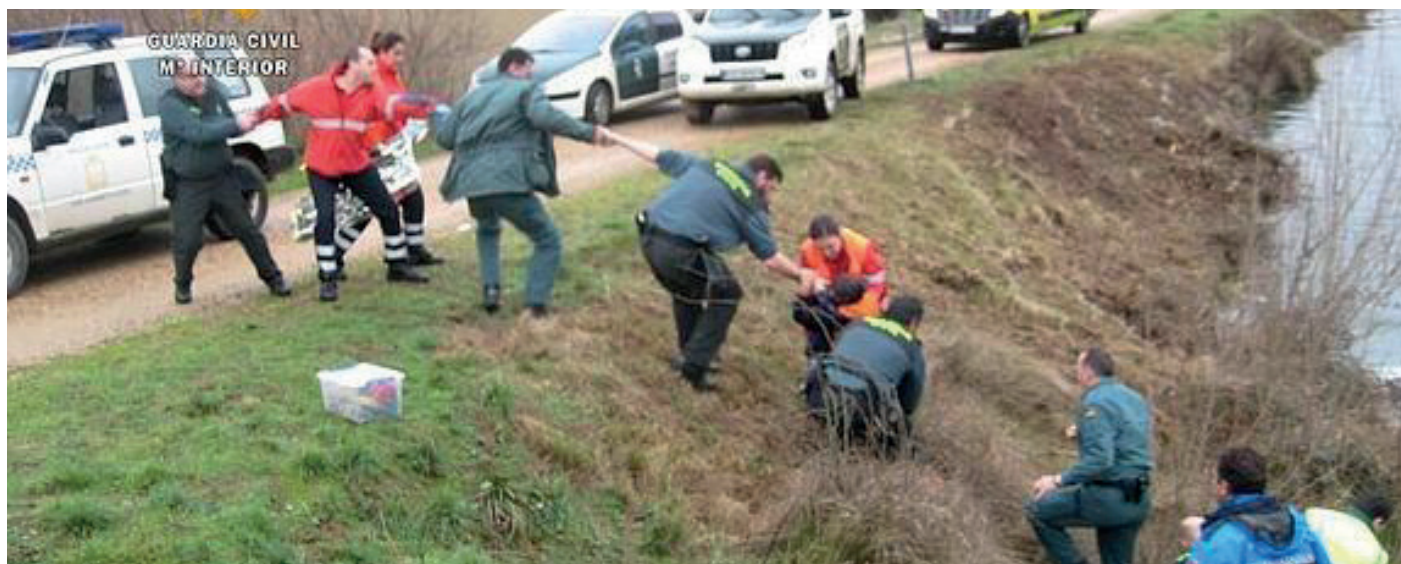
Momento en el que el menor es izado a tierra por parte de los guardias civiles.