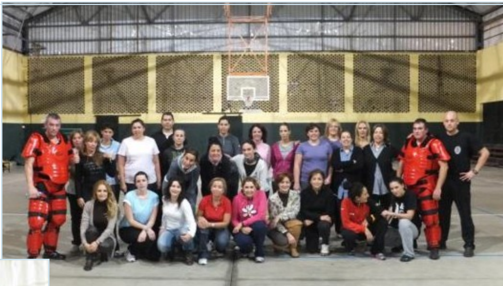
Arriba las participantes en el curso y a la izquierda un momento de la parte práctica del curso.

Una jornada que sirvió para enseñar a cerca de 40 mujeres como defenderse y dar respuesta a situaciones de riesgo, que no sólo pueden sorprender en la calle, sino como ocurre desgraciadamente a menudo, en el