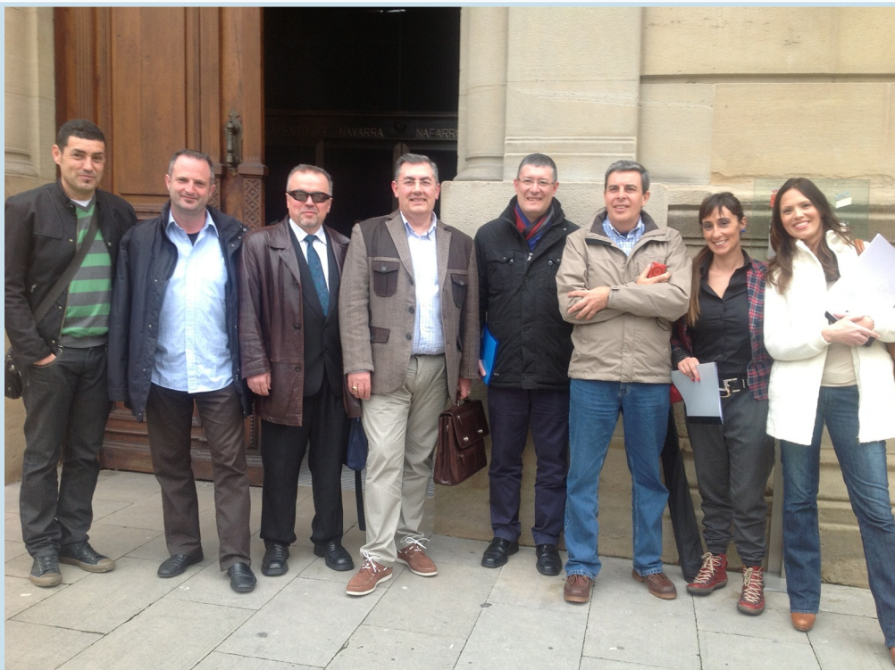
Los representantes de AUGC y SUP a la entrada del Parlamento Foral

En su intervención ante la comisión los representantes de la dos organizaciones se han referido al grave problema que tiene en la actualidad el sistema policial español y que no es otro que el de la descoordinación. Una afirmación esta que también han compartido los grupos parlamentarios. Asimismo AUGC y SUP han reconocido ante los parlamentarios autonómicos el caos policial y la lucha brutal por las estadísticas entre los cuerpos. Lo que les ha llevado a abogar por una mayor coordinación operativa.