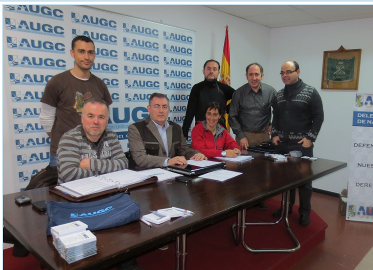
La nueva junta directiva navarra junto a la Secretaria Nacional la Mujer el día de las elecciones.

-Los responsables políticos y de la Guardia Civil cómo han reaccionado ante la idea de tener más representantes de AUGC en la Comunidad Foral?.