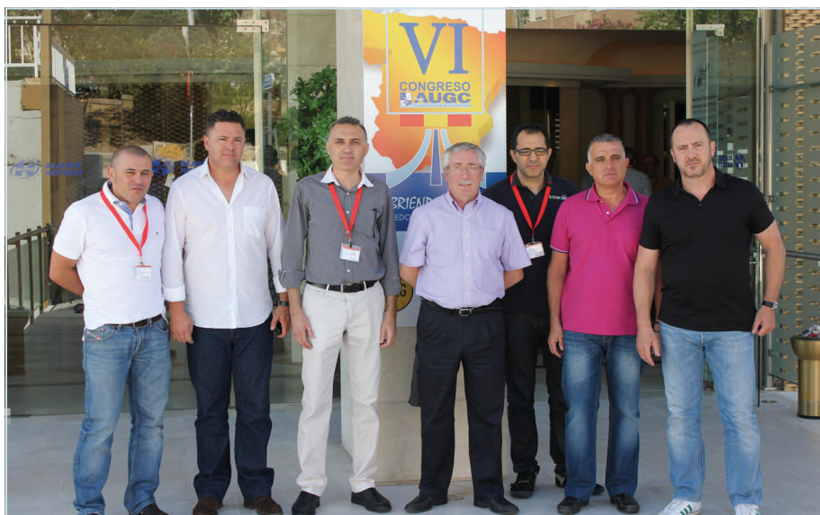
Miembros de la Junta Directiva Nacional de AUGC reciben al líder sindical a la entrada del Auditorio en el que se celebraba el Congreso.

Los avances que se registren en mesa supondrán la consolidación de las asociaciones profesionales dentro de la guardia civil, el derecho de expresión de sus representantes, porque aún continúan abriéndose expedientes a los representantes asociativos por hacer uso de este derecho constitucional.