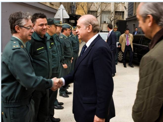
El ministro saluda a los representantes de la Asociaciones Profesionales a su llegada.

El Punto 5º, Reactivación del Observatorio de la Mujer , va a ser llevado a efecto, mostrando su compromiso con el mismo. La representante de AUGC expone toda una batería de medidas a llevar