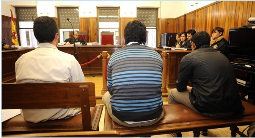
Los tres acusados ante el tribunal que les juzgó por la agresión a los guardias civiles.

Los cinco acusados han sido considerados por la titular del Juzgado de Albacete como autores de un delito de atentado, por el que son condenados cada uno, a tres años y seis meses de prisión, otro delito de lesiones, que les supone otra condena de ocho meses de prisión a cada uno y una falta de maltrato por la que han sido condenados a 20 días de multa a razón de 6€ diarios. Condenas