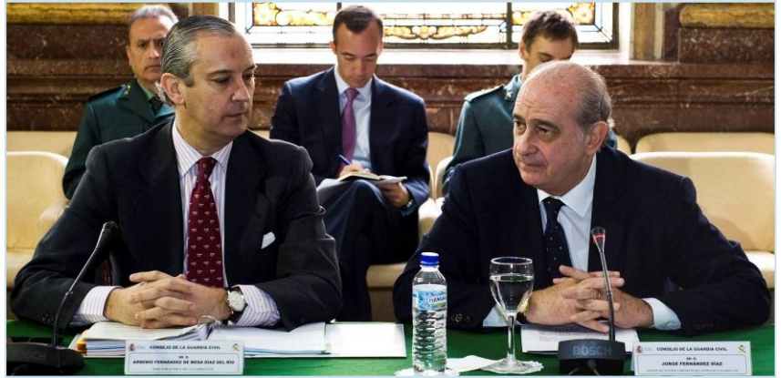
Primer Consejo de la Guardia Civil presidido por el nuevo ministro del Interior y el nuevo Director General.

tro que esta nueva etapa termine con la persecución a los cargos asociativos, y además, se potencie el Consejo de la Guardia Civil “donde confluyen sensibilidades diferentes, pero como decimos también intereses comunes” . “El Consejo nació para mejorar la eficacia del Cuerpo y también para lograr una Guardia Civil más eficaz, moderna y donde sus