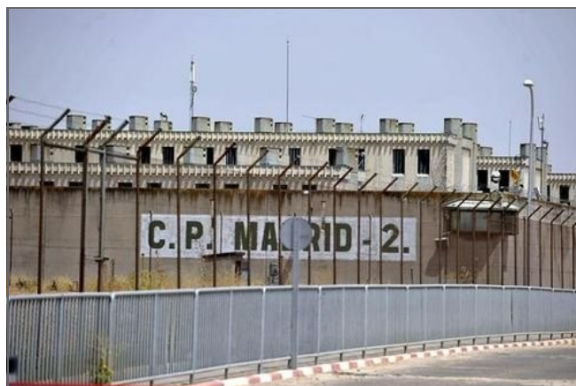
AUGC introdujo como uno de los temas principales, la privatización de la vigilancia de los centros penitenciarios.

2.- Si bien es una decisión operativa ya tomada por el Gobierno y que va a llevar a efecto la Secretaría de Estado, AUGC defenderá con todos los medios asociativos y legales a su alcance, los intereses de los guardias civiles afectados (destinos, lugares de residencia, etc.) para que su vida personal y familiar no se vea afectada en ninguna forma por esta decisión gubernamental.