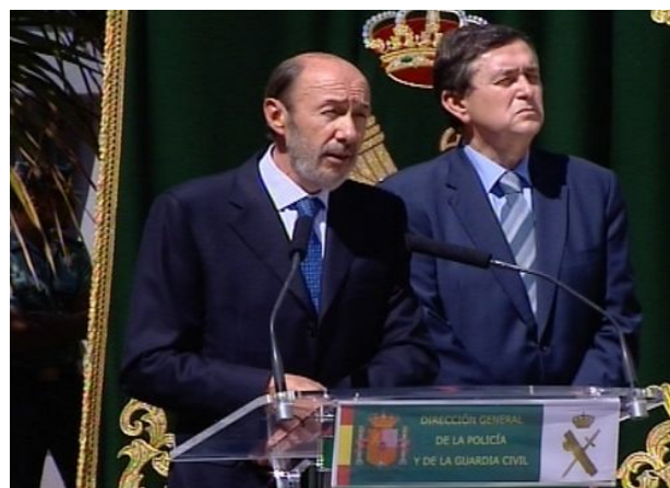
Inauguración del nuevo curso en la Academia de Oficiales

nados en atentado perpetrado en Afganistán por los talibanes, volvió a insistir en que en aquella región no había guerra cuando todo el mundo aprecia lo distinto. Es la soledad del ministro. AUGC insistió en la preocupante precipitación del Gobierno a la hora de enviar y mantener a guardias civiles en escenarios que son -por más que se quiera negar- bélicos. La Guardia civil está realizando misiones internacionales con éxito, en tareas de apoyo y formación a cuerpos policiales en otros diversos países, pero este Cuerpo de Seguridad no está preparado para actuar en zona de guerra, como es Afganistán. Lo que abre de nuevo, según AUGC, el debate sobre la indefinición estatutaria en la que se empeña en mantener el Gobierno a la Guardia Civil, cuando, porque pese al mandato normativo, elude