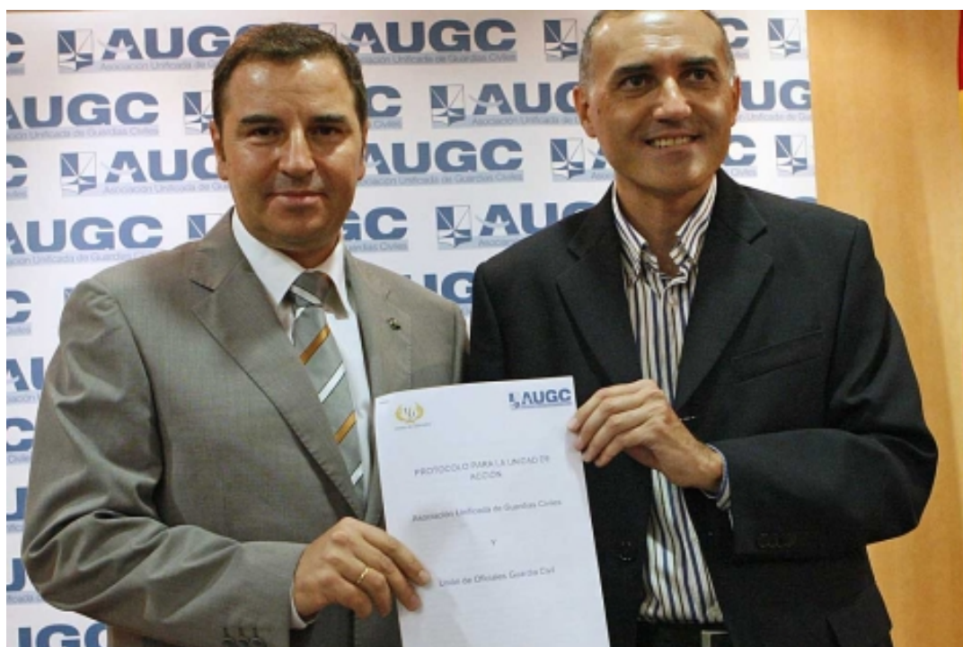
AUGC y UO firman un protocolo de Unidad de Acción al coincidir en ambas organizaciones intereses comunes a sus respectivos afiliados