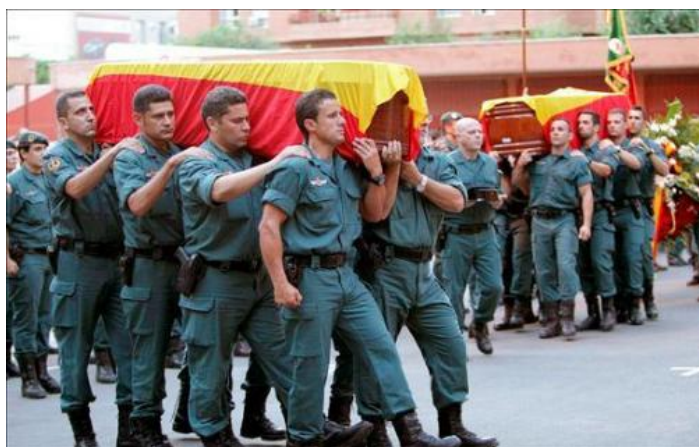
Imagen de funeral en Logroño el 26 de agosto de 2010.

vil de que homologue la jornada laboral con la policía, el señor Rubalcaba sale defendiendo la naturaleza militar de la institución para justificar que los derechos laborales y profesionales de los guardias civiles sean inferiores a los policías. Hombre, en todo caso, los guardias