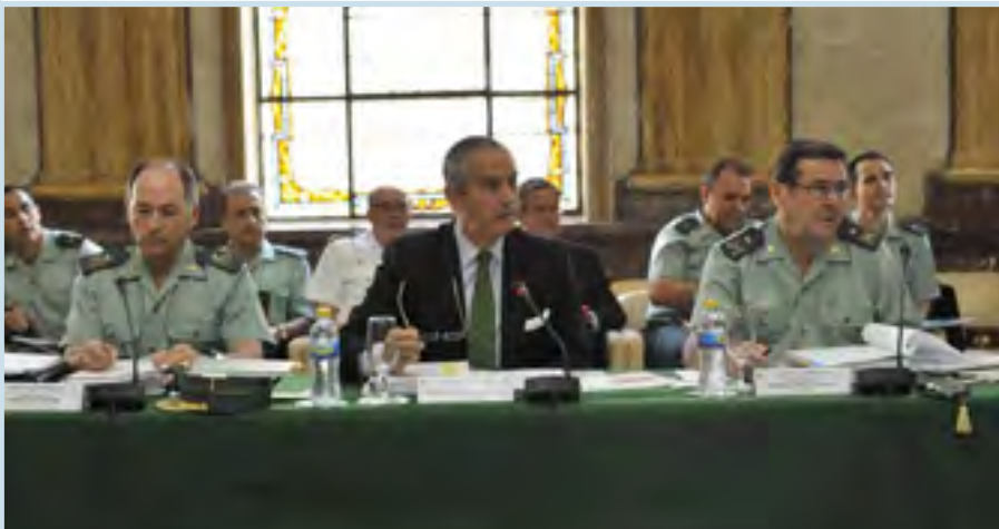
El Director General de la Guardia Civil durante una de las reuniones del Consejo de la Guardia Civil.

Una vez más tendrá que ser la Justicia la que enmiende el disparate que esta normativa va originar en esta Institución. Un desatino aún mayor en esta ocasión porque, como muy