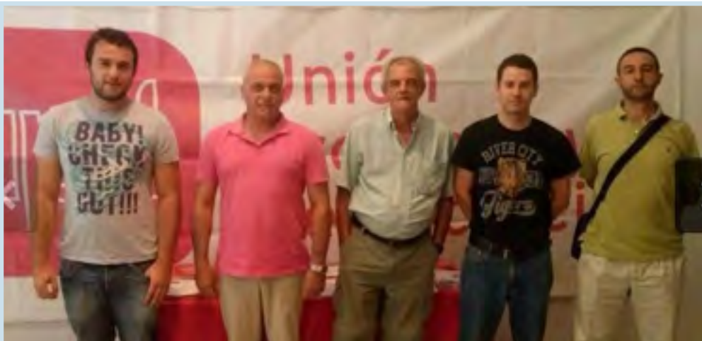
Representantes de AUGC Badajoz junto a los miembros del Consejo Local de UPyD

Desde UPyD Badajoz se ha relacionado este punto con su propuesta de Fusión Municipal