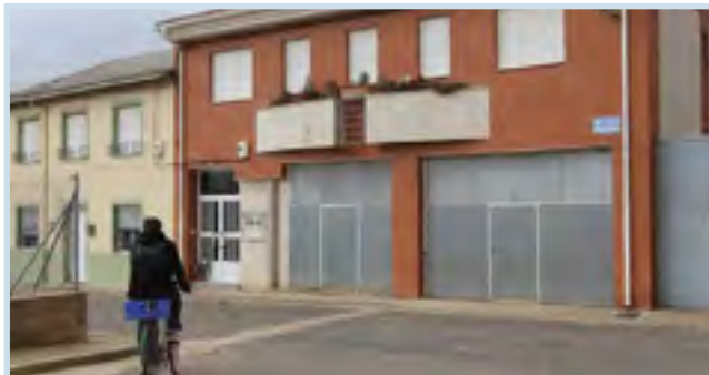
La vivienda en la que se produjo el disparo que hirió al agente se encuentra en el centro del pueblo.

Para AUGC es indigno que la Guardia Civil