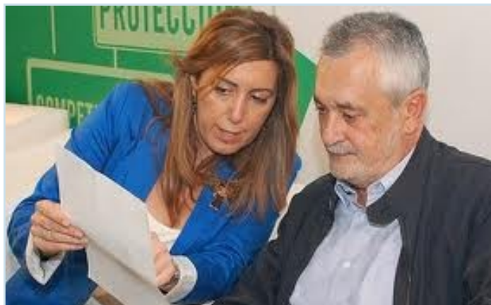
Susana Díaz, sec. de Organización del PSOE de Andalucía, y el presidente andaluz, José Antonio Griñán, quienes han vertido duras críticas contra la UCO por su atestado sobre el caso de los ERES falsos de la Junta.

AUGC recuerda a los que estos días han intentado echar por tierra esta investigación realizada desde la condición que ostentan los guardias civiles, como Policía Judicial, y por tanto, siguiendo las instrucciones que se marcan desde los Juzgados y Tribunales. Lo que es claro es que las Fuerzas y Cuerpos de Seguridad no están para servir a