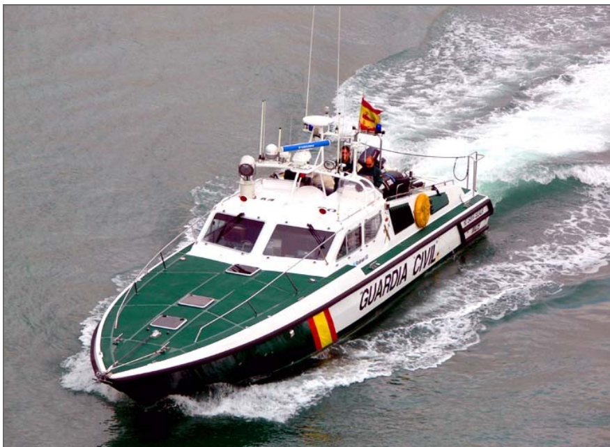
Este año las bajas por jubilación en la guardia civil no se verán compensadas con la oferta de empleo público

Así las cosas, se anunció que nuestra posición será volver a impugnar ante los Tribunales de Justicia, la normativa que se pretende aprobar.