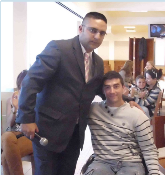
El compañero de APG/GNR homenajeado en la 21 Aniversario de la Associação dos Profissionais da Guarda Portuguesa.

mento, y así agradecer el gran trabajo como asociación profesional que realiza AUGC, y en reconocimiento de los derechos y deberes de todos los guardias civiles.