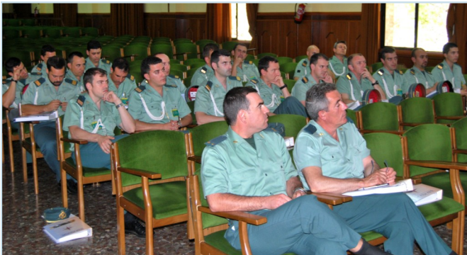
Asistentes a la presentación de AUGC en el aula magna de Baeza

Asimismo se les presentó la modificación sobre vacantes de suboficiales, donde se ha tomado como referencia, por parte de la Dirección una propuesta de AUGC. De tal forma, que aquellas que son anunciadas para subtenientes/brigadas pasaran a ser de sargentos/sargentos 1º/ brigadas. AUGC, había presentado una propuesta en la que se solicitaba que los ascensos de los suboficiales no conllevaran destinos, entre otros puntos. Documento que fue el que finalmente presentó la propia Dirección General en la mesa de trabajo celebrada en el mes de febrero bajo el epígrafe “estudio sobre el impacto de cambio de las vacantes de suboficiales”.