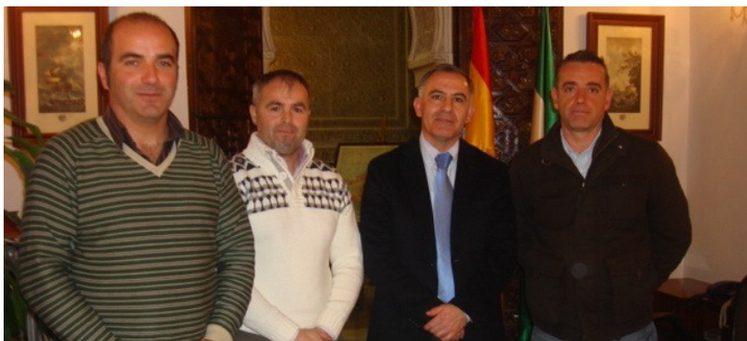
La Junta directiva de AUGC Granada junto al nuevo subdelegado del gobierno en la provincia.