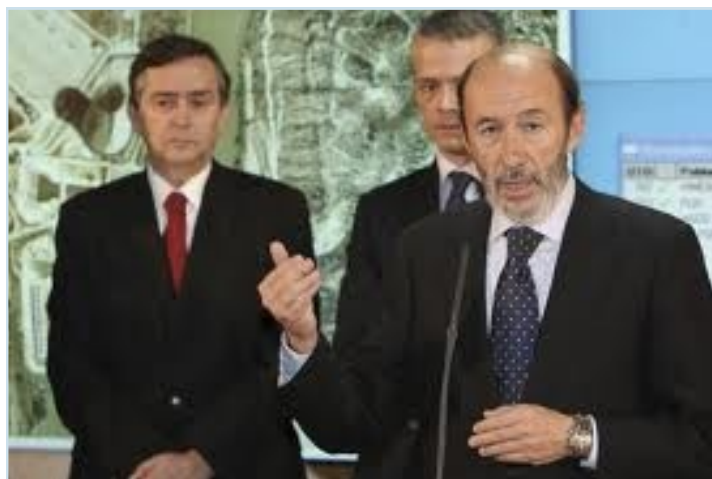
Los tres hombres fuertes del Ministerio del Interior en la última etapa socialista

Organización inició también, en su momento, otras acciones legales en espera de si se admitía a trámite o no, la iniciativa procesal de