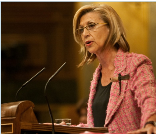
Rosa Díez, UPyD

Rosa Díez, en nombre de su formación política defendió, una vez más a la Comisión de Interior, la necesidad de modificar la Ley Orgánica 12/2007, de 22 de octubre, relativa al Régimen Disciplinario de la Guardia Civil y la Ley Orgánica 13/1985, de 9 de diciembre, en la que se aprobó el Código Penal Militar. Con esta proposición no de Ley UPyD pedía que no se aplique este código en el día a día a los guardias civiles.