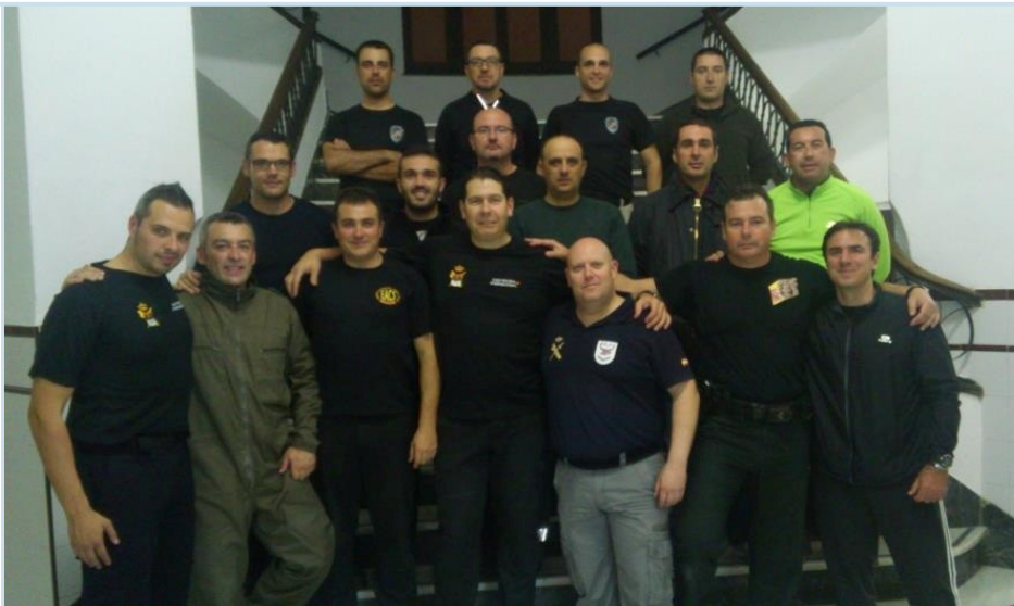
Instantánea de los asistentes al curso sobre violencia de género promovido por AUGC

puestos de Violencia de Género. El curso taller estaba organizado por AUGC con la colaboración del grupo Formación, Defensa y Protección, que ha impartido otros cursos presenciales de intervención policial.