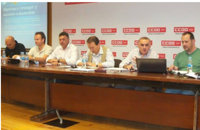
Miembros de la JDN presentan el Plan Estratégico Nacional

Los secretarios generales provinciales y federales de AUGC acudieron el pasado 9 de mayo a la presentación del 'Plan Estratégico para el desarrollo y la extensión de la AUGC' que realizó la JDN.