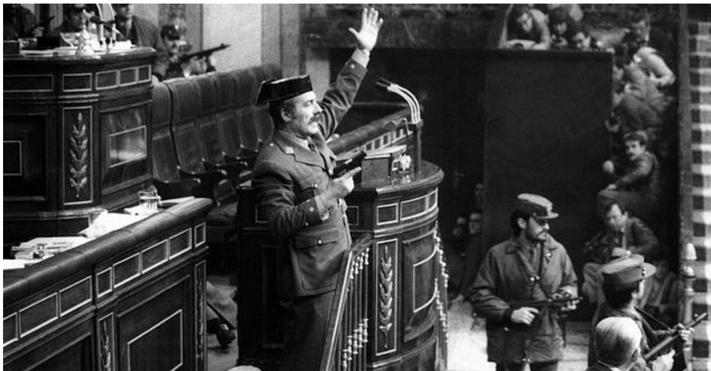
Antonio Tejero Molina durante el 23-F

AUGC reclama la dimisión del ministro del Interior, Jorge Fernández Díaz, por la nefasta gestión de este caso