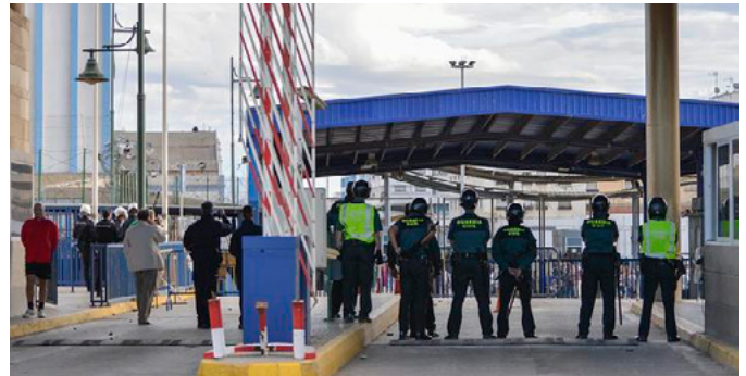
Puesto fronterizo de Farhana

La organización, que ha trasladado el pésame a la familia del bebé fallecido, hijo de otro compañero destinado en el País Vasco, ha solicitado para los dos agentes que intervinieron la concesión, por parte de la DGGC, de la medalla al mérito civil al considerar que “son actuaciones, como la llevada a cabo por estos dos compañeros, las que hacen que los trabajadores de esta Institución sean los mejor valorados por la sociedad. Son estos actos los que han dado el nombre a la Benemérita y no otras que hacen que el trabajo de los agentes sea cuestionado y puesto en duda”. Desgraciadamente, en esta ocasión, los esfuerzos de los dos guardias civiles no se han visto recompensados con un final positivo para el bebé y sus padres.