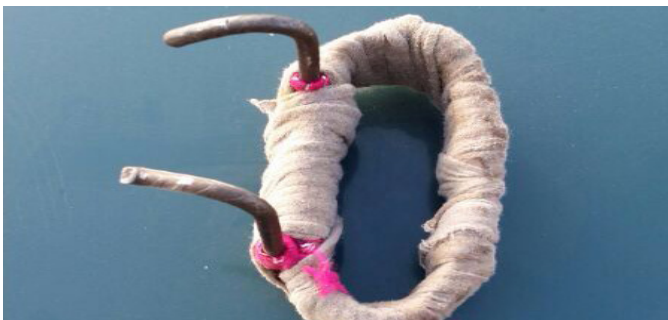
Método utilizado por inmigrantes para sortear la valla

Aunque la malla anti-trepa ha resultado, en un primer momento, ser eficaz para impedir las avalanchas de inmigrantes, éstos, como pronosticó AUGC, ya han buscado la manera de sortearla.