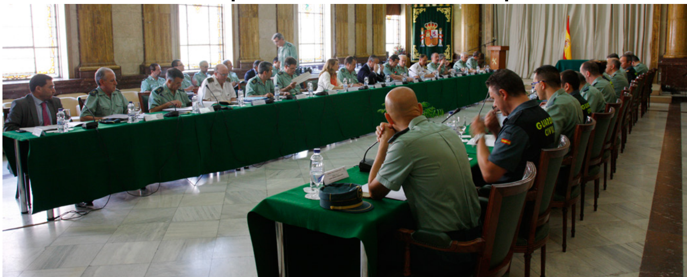
Pleno del Consejo de la Guardia Civil.

El Pleno del Consejo de la Guardia Civil, que se celebró el lunes 30 de junio , ha aprobado, a pesar del rechazo frontal de AUGC, la aplicación de un nuevo Resumen de Actividades Individuales (RAI) para los guardias civiles.