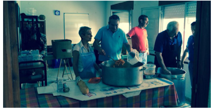
Miembros de AUGC Toledo colaboran en un comedor social

En las escasas tres semanas que ha durado la campaña se ha conseguido recaudar más de 1.000 kilos de alimentos no perecederos que la asociación entregó a los voluntarios de este comedor que reparte a diario 200 raciones entre los más necesitados de los municipios toledanos de Arges, Nambloc, Burguillos, Cobisa y Layos. Raciones que con la llegada de las vacaciones escolares se verán incrementadas al cerrarse los comedores escolares.