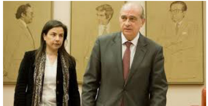
El ministro del Interior junto a la diputada de Bande

La Guardia Civil no ha podido sancionar al sargento responsable de esta unidad sencillamente porque no