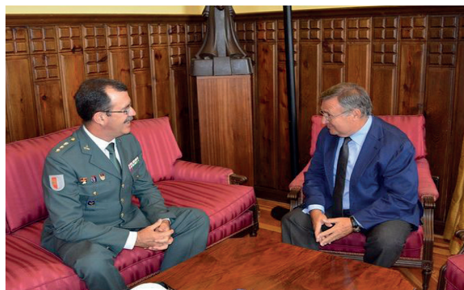
El jefe de la Comandancia de Toledo, con el presidente de la Diputación de esa provincia.

La sociedad a la que nos debemos demanda efectividad y eficacia en el servicio policial de la Guardia Civil y es en ese aspecto en el que debe de incidir todo un Jefe de Comandancia y no el encontrarse a un subordinado en una cafetería y exigir que este último le grite a viva voz delante de todos los presentes “A la orden de Usía mi Coronel”