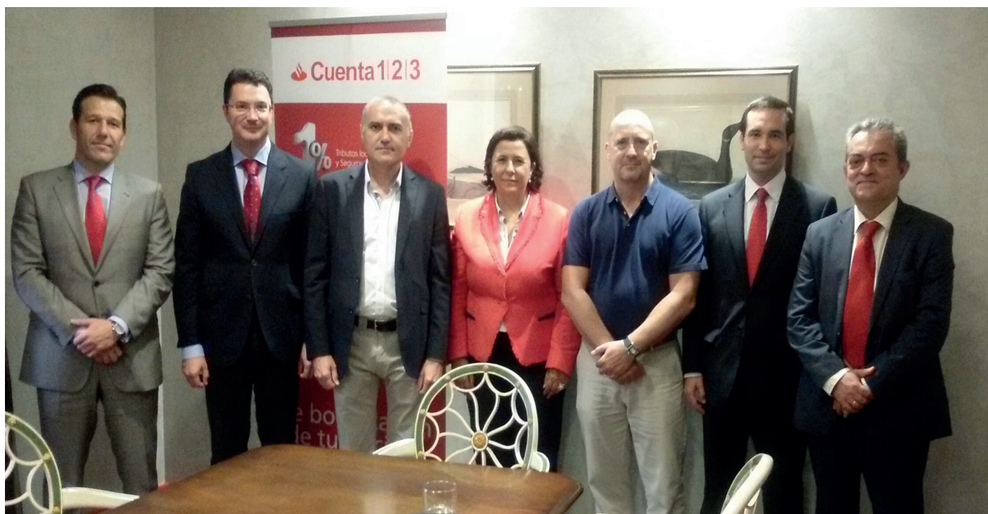
Los representantes de AUGC y del Banco Santander posan tras la firma del acuerdo.

La Asociación Unificada de Guardias Civiles acaba de firmar un convenio de colaboración con el Banco Santander que ofrece a sus afiliados una amplia gama de productos y servicios financieros altamente interesantes. Las características y condiciones del Servicio Financiero Integral Específico que ha creado esta entidad bancaria para los guardias civiles integrados en AUGC puede consultarse en la web www.santander-funcionarios.es/augc .