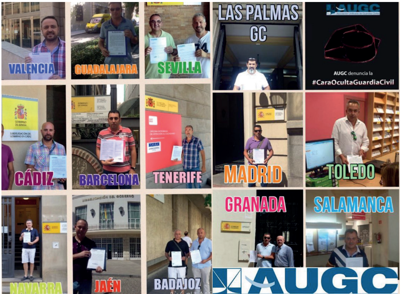
Mosaico con la entrega de las cartas en varias de las delegaciones provinciales de AUGC.

Representantes asociativos de AUGC de toda España han iniciado una campaña de entrega de cartas al director de la Guardia Civil y a los delegados y subdelegados del Gobierno en cada comunidad y provincia ante la creciente ola de represión en forma de expedientes por falta grave que ha iniciado la DG.